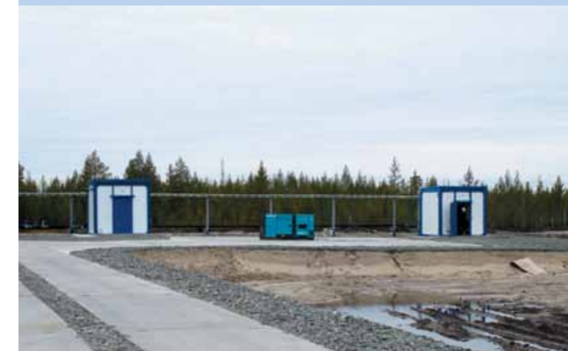
PlanaNS-V-29 и PlanaVP-10

Установки водоподготовки предназначены для очистки воды из подземных (артезианских) или поверхностных природных источников до требований норм СанПиН 2.1.4.1074-01 «Вода питьевая. Гигиенические требования к качеству воды централизованных систем водоснабжения» по органолептическим свойствам, показателям бактериального и санитарно-химического загрязнения и напорной подачи очищенной воды потребителям. Установки применяются в системах хозпитьевого и производственного водоснабжения.